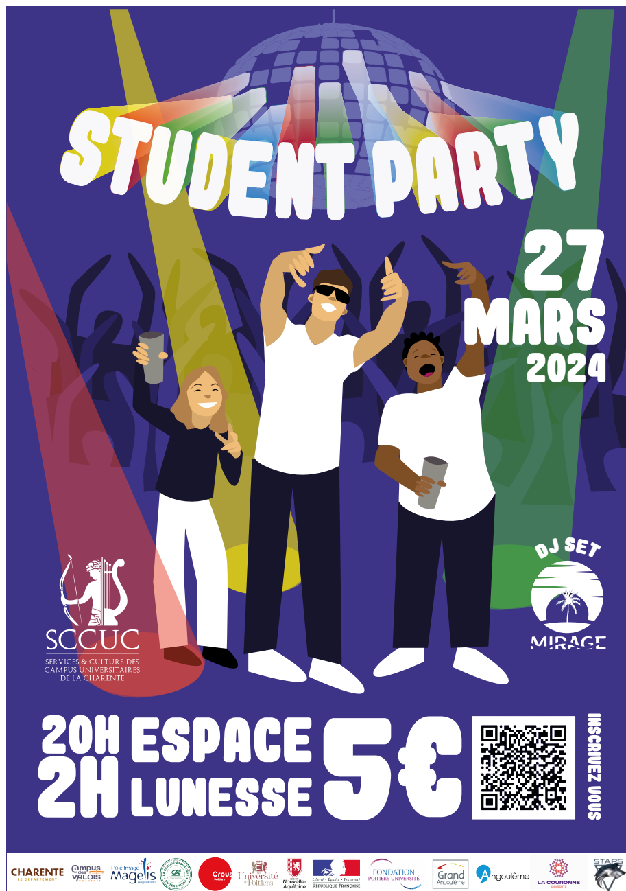
Affiche finale pour la Student Party

Mon travail de communication a apparemment porté ses fruits, car nous avons réussi à remplir largement la salle de fête le mercredi 27 mars. Pendant la soirée, j'ai également assuré la communication en direct en créant des story*, etc.