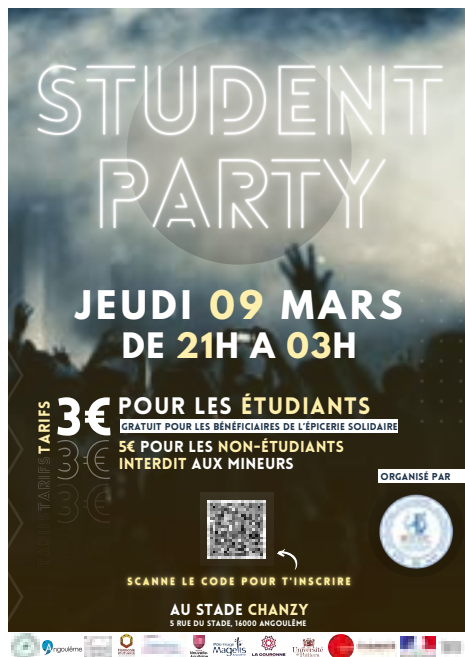
Affiche de l'année dernière