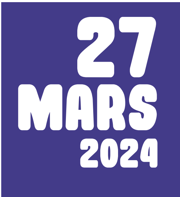
Police utilisée : Rockin' record