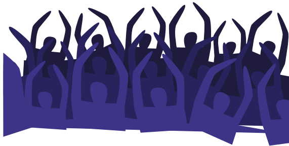
Foule en arrière plan